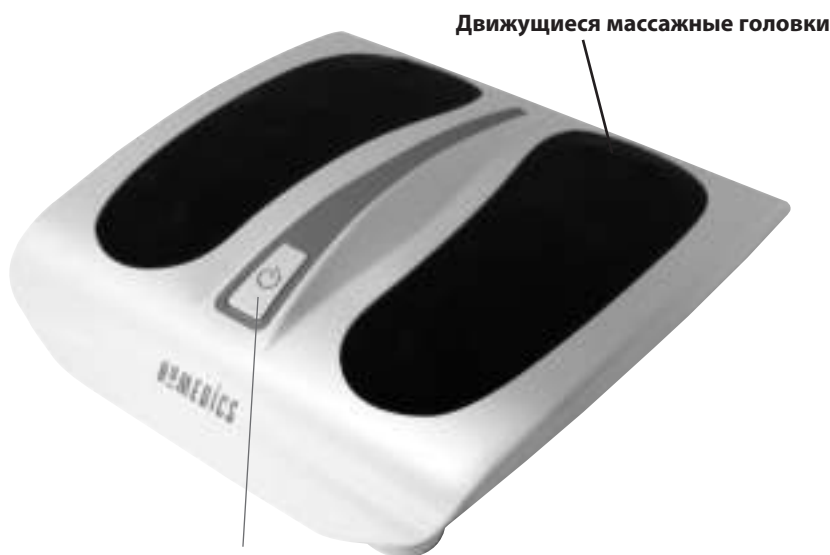
Движущиеся массажные головки