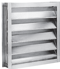
ATO75 600X400 VOL/GAINE

Le volet en gaine anti-retour ATO 75 permet la mise en dépression ou en surpression d'un local.