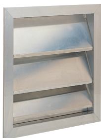
AVF75 800X500 V/DEPRESS

Le volet mural anti-retour AVF 75 permet la mise en dépression d'un local.