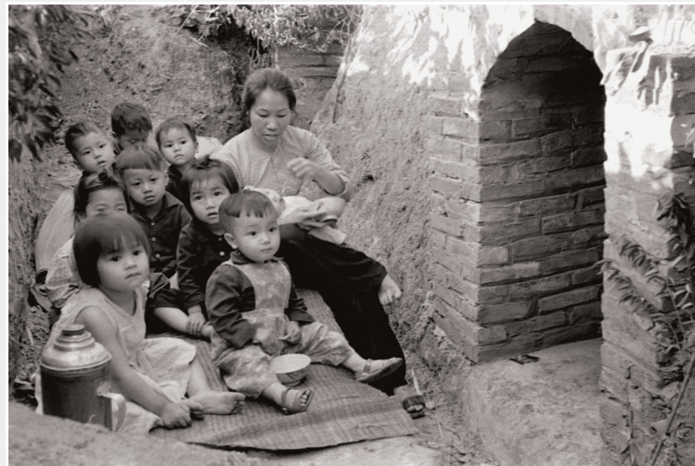
2. Nhà trẻ của Xi nghiệp Công nghệ thực phẩm Quảng Ninh có hầm tránh bom rất vững chắc. The Kindergarten established by Quảng Ninh Food Industry had a solid bomb-proof shelter.