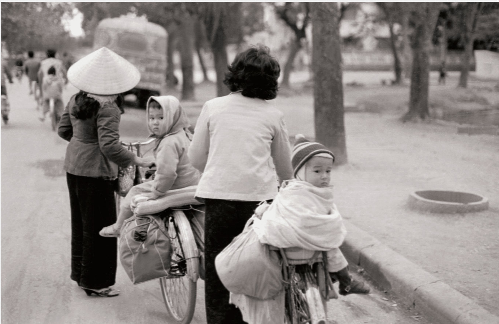
1. Người già, phụ nữ và trẻ em rời Thủ đô đi sơ tán trong những ngày cuối tháng 12 năm 1972. The elderly, women and children evacuated from the Capital city on the last days of December, 1972.