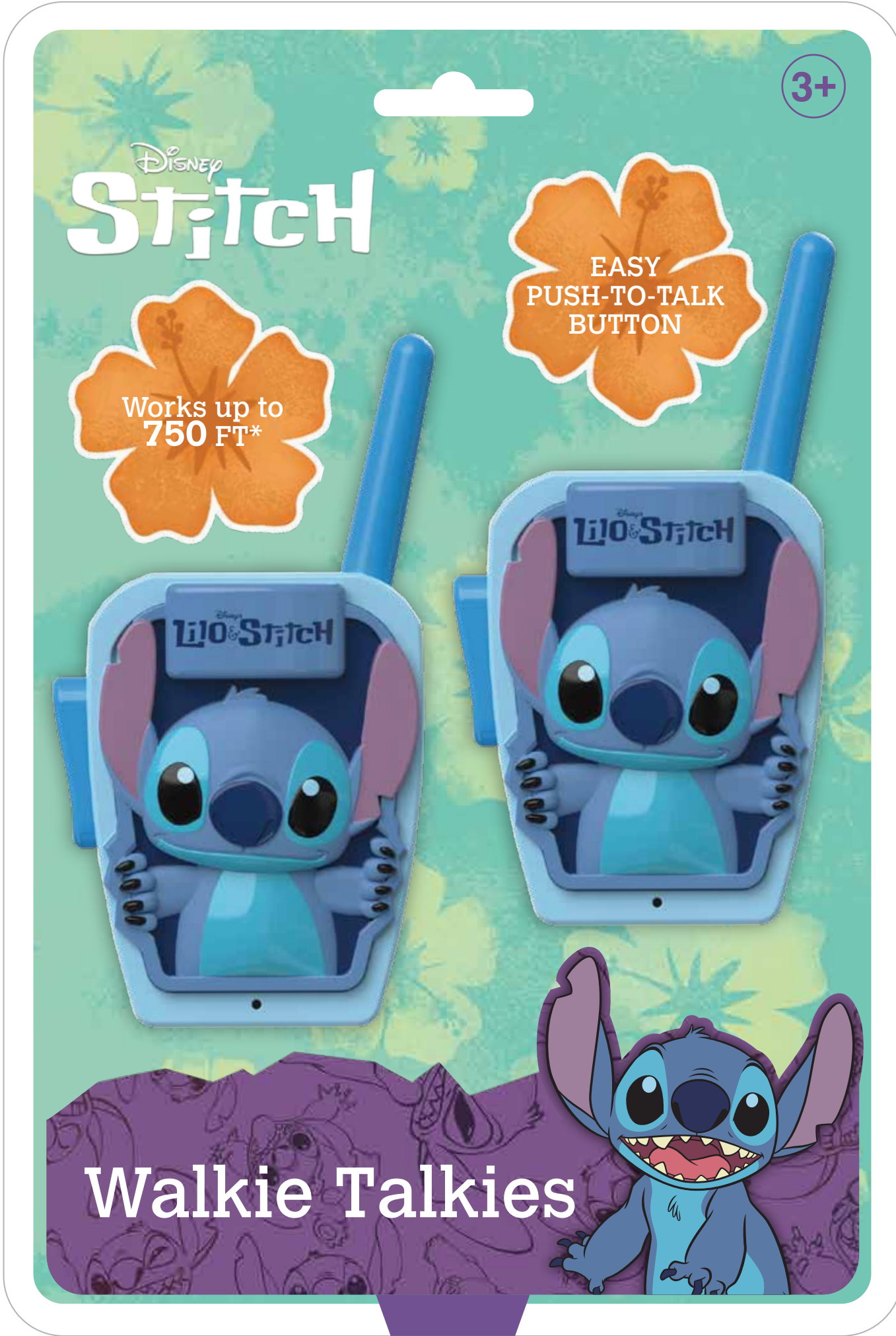
PRODUCT PLACEMENT FOR REFERENCE