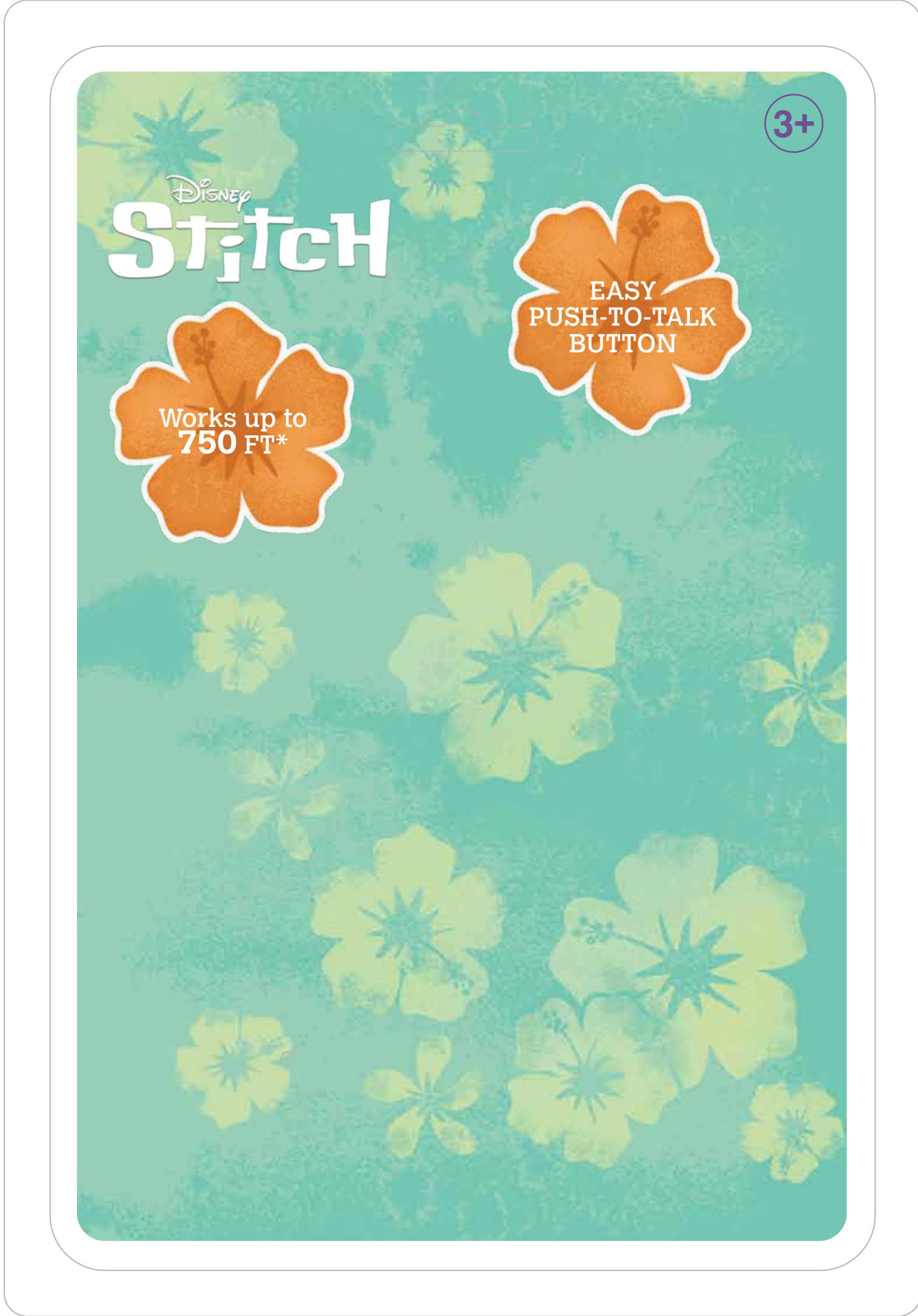
Front PVC sheet