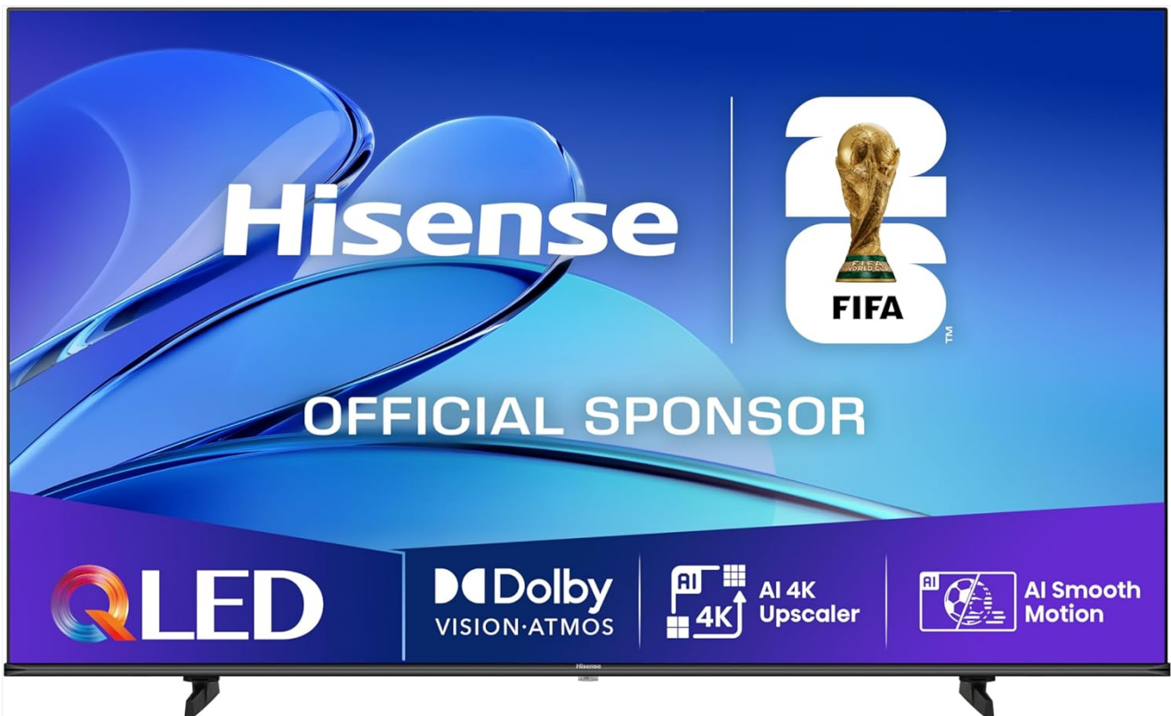
Front view of the Hisense 65E7Q QLED Smart TV.

The Hisense 65E7Q QLED Smart TV offers a premium viewing experience with its 65-inch QLED display. This television integrates advanced technologies such as Dolby Vision and Dolby Atmos for immersive audio-visuals, AI Smooth Motion for fluid images, and dedicated modes for gaming and sports. Powered by the VIDAA operating system, it provides easy access to a wide range of streaming content and smart features, including voice control.