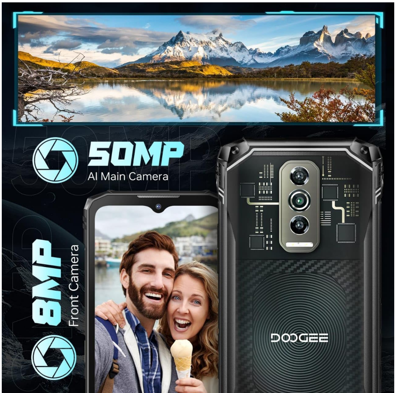
Image: Illustration of the smartphone's camera setup, featuring the 50MP AI main camera and 8MP front camera.

Capture clear photos with the 50MP AI Main Camera and take selfies with the 8MP Front Camera.