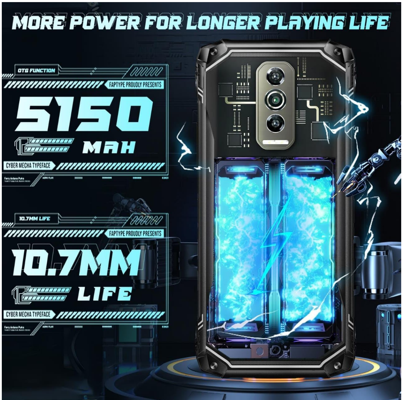
Image: Depiction of the 5150mAh battery, emphasizing its capacity for longer usage.