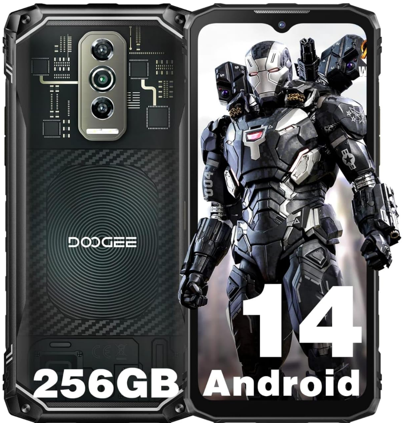
Image: Front and back view of the DOOGEE Blade 10 Ultra (2025) Rugged Smartphone, showcasing its robust design and camera module.