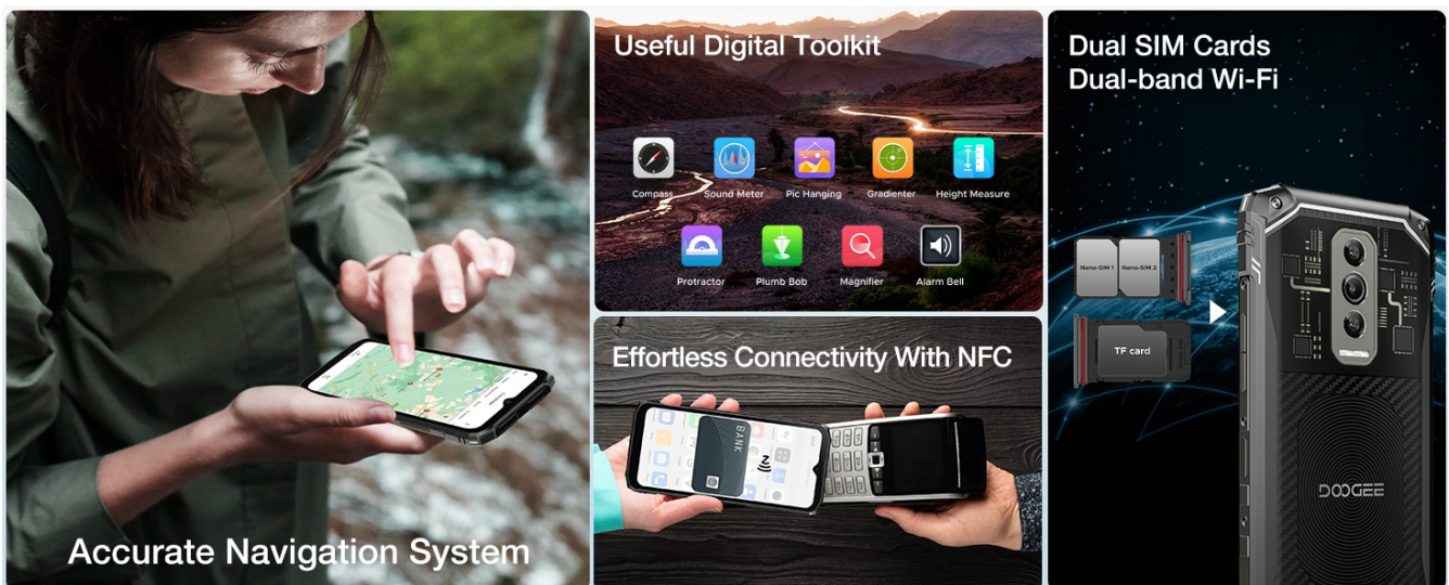
Image: Diagram illustrating the insertion of dual SIM cards and a TF (microSD) card into the phone's tray.

The DOOGEE Blade 10 Ultra supports dual SIM cards and a microSD card for expanded storage. Locate the SIM tray on the side of the device. Use the provided SIM ejector tool to open the tray. Carefully place your Nano-SIM cards and/or microSD card into the designated slots, ensuring correct orientation. Close the tray securely.