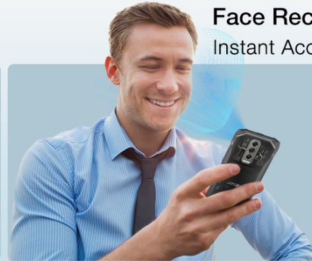
Image: Illustration showing the side fingerprint recognition and face recognition features for unlocking the device.