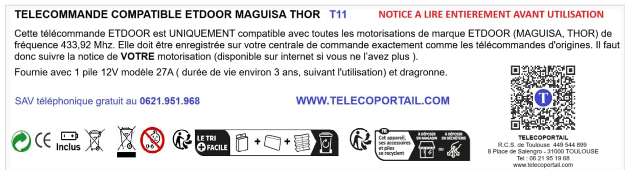
Figure 5: Support Contact Details

For any questions or assistance regarding the T11 remote control, please contact our customer support team. Free assistance is available via email or phone.