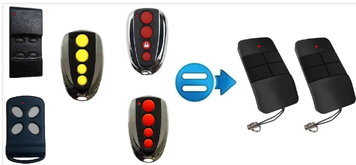
Figure 1: T11 Remote Control and Compatible Original Models

This manual provides essential information for the T11 4-channel rolling code 433MHz remote control, designed for garage door systems. This remote is a compatible replacement and requires programming to your existing motorization unit.