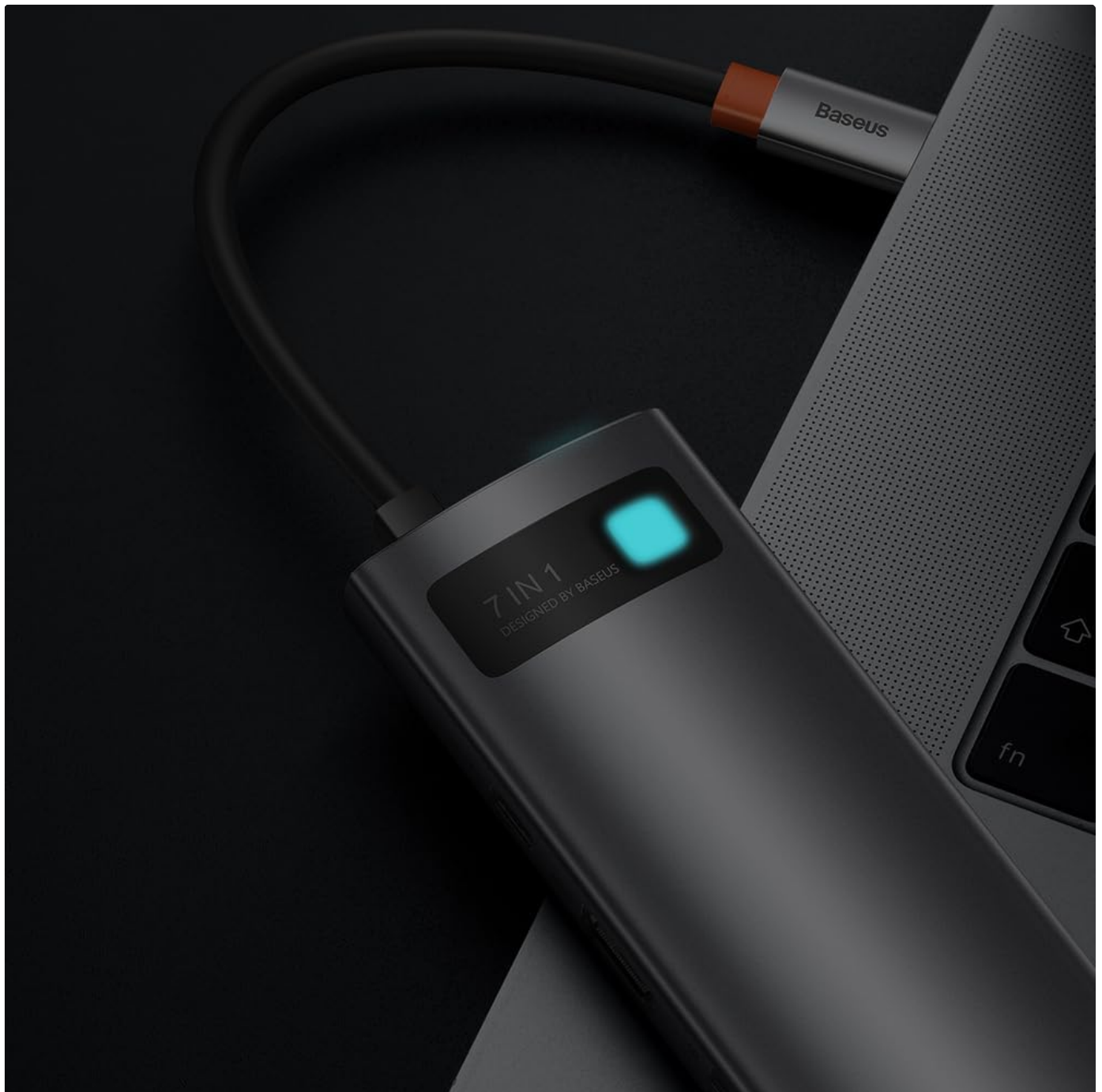
Image: The Baseus 7-in-1 HUB connected to a laptop, demonstrating its compact size and integration into a workspace.