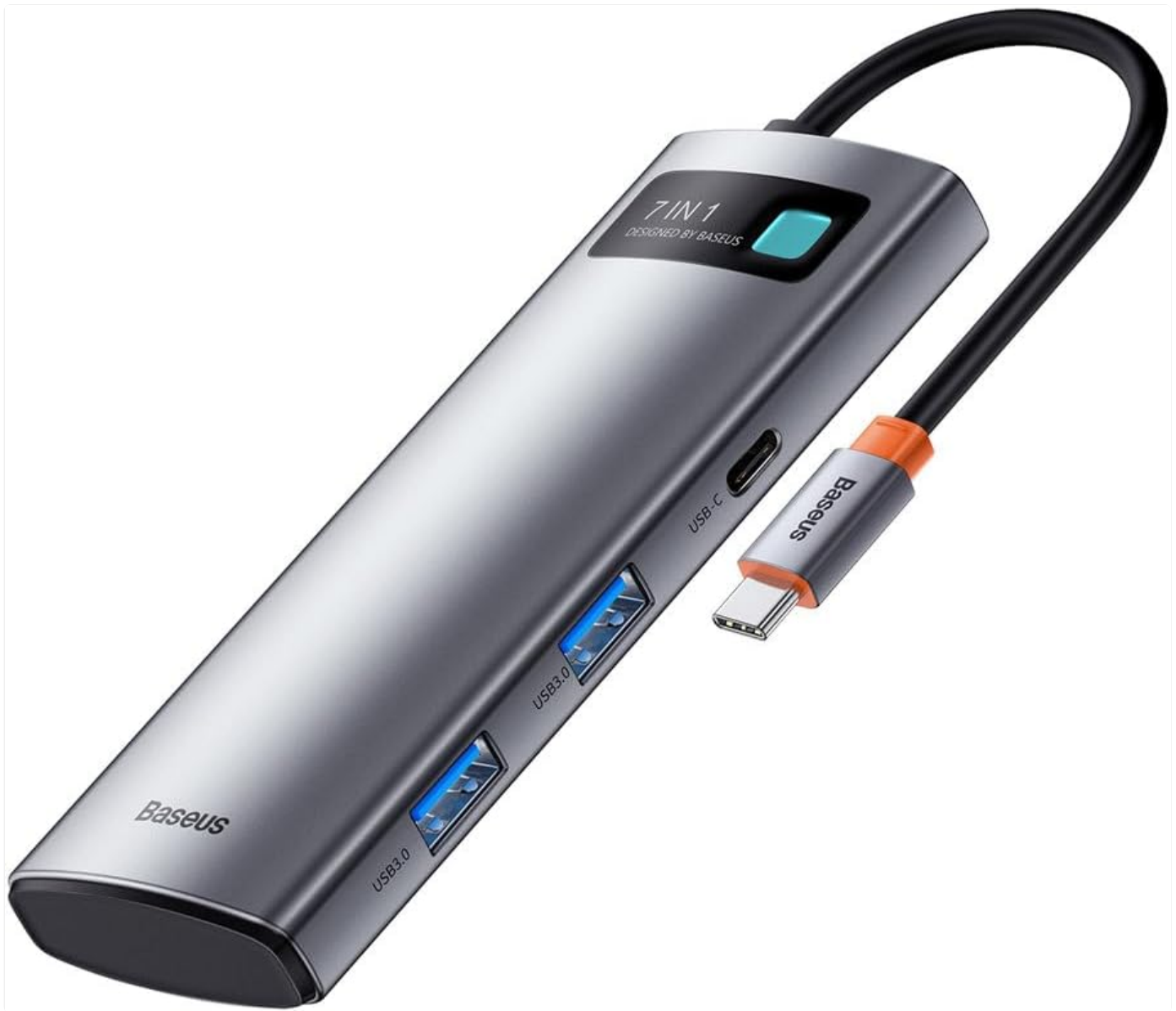
Image: The Baseus Metal Gleam Series 7-in-1 Multifunctional Type-C HUB, showcasing its sleek design and multiple ports.