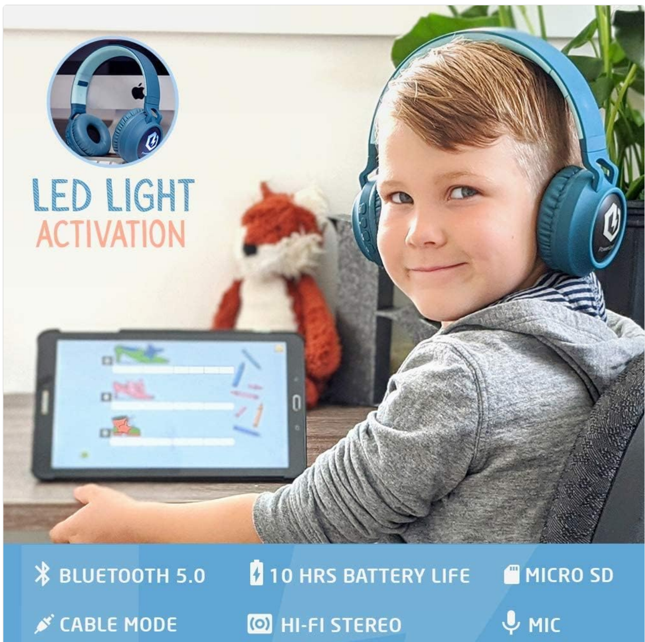
Image: A young boy wearing the PowerLocus Kids Headphones, comfortably engaged with a tablet, illustrating the wireless functionality.