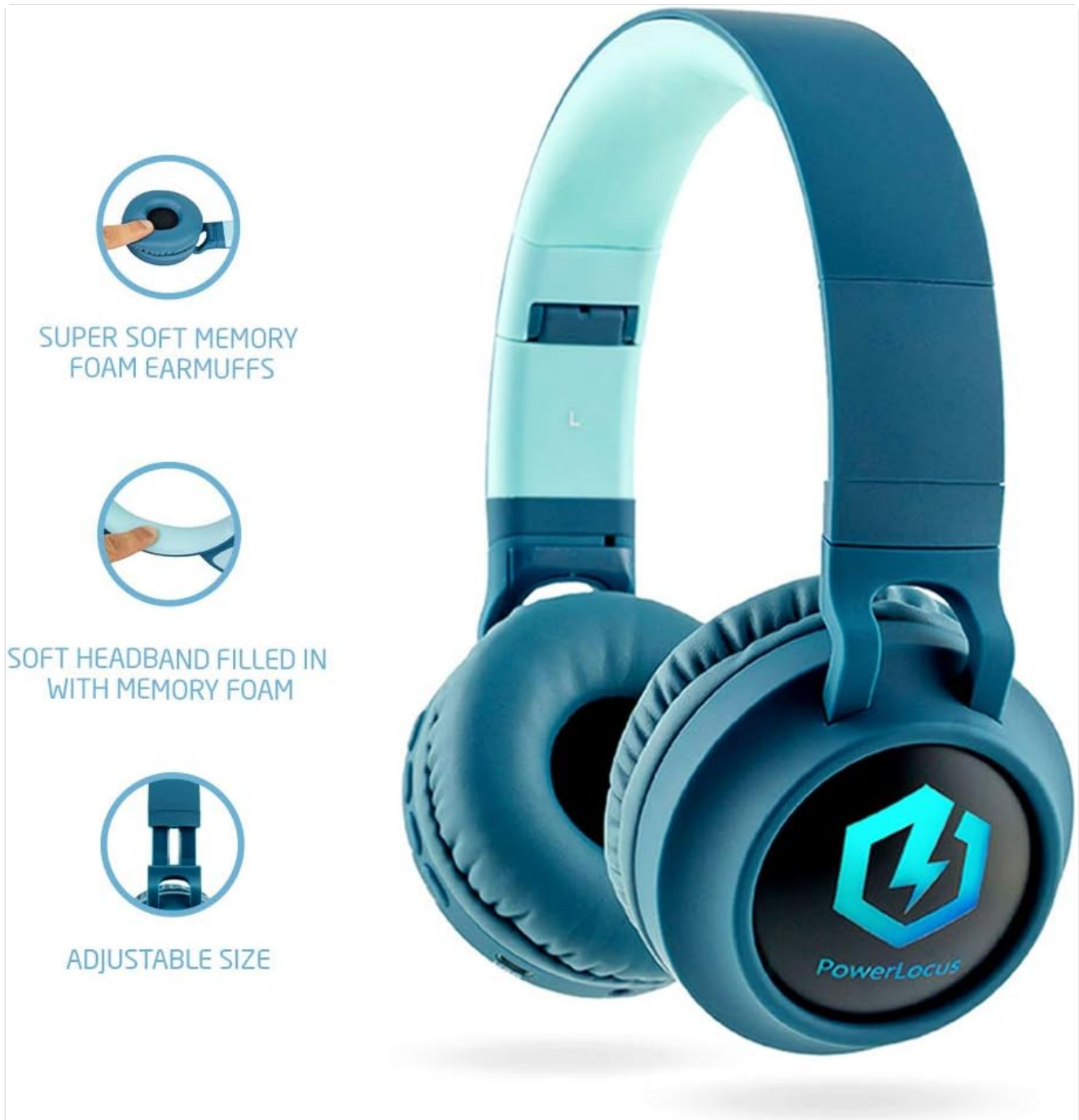
Image: The PowerLocus Kids Headphones shown in their folded configuration, highlighting their portability and ease of storage.

When not in use, fold the headphones for compact storage and place them in the provided carrying pouch to protect them from dust and scratches.