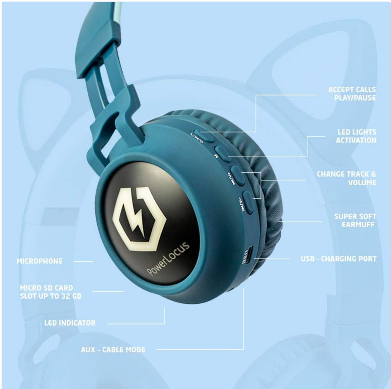
Image: The PowerLocus Kids Headphones with their distinctive LED lights glowing on the earcups, showcasing the visual feature.

The headphones feature colorful LED lights on the earcups. Use the dedicated LED Light button to activate or deactivate them. Multiple light modes are available.