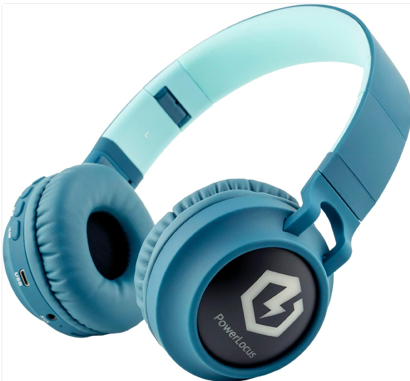
Image: A close-up of the headphone earcup, highlighting the various control buttons, the built-in microphone, USB-C charging port, AUX input, and Micro SD card slot with their respective labels.