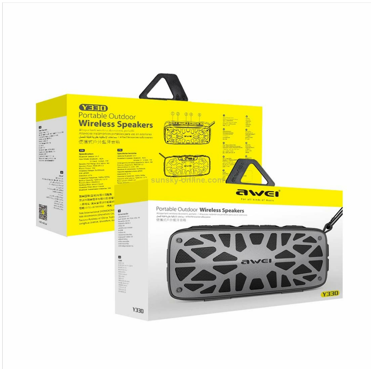
Image: The AWEI Y330 speaker shown with text indicating 'LARGE POWER LONG TIME', '1200mAh /3.7V' battery capacity, '3-4 H charge', and '4h playing time'.