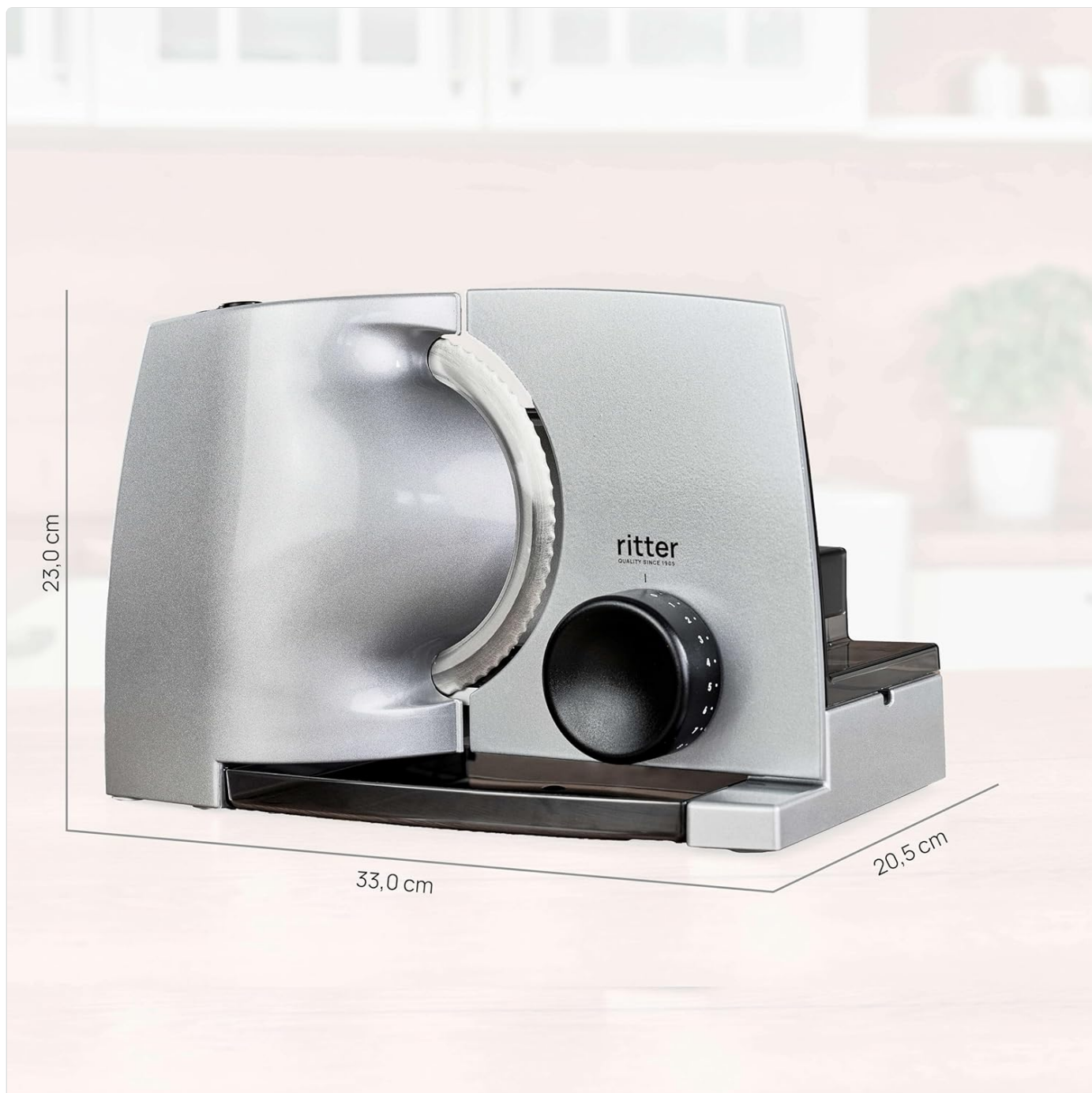
Image: The ritter compact 1 slicer with its key dimensions (height, length, width) clearly indicated for reference.