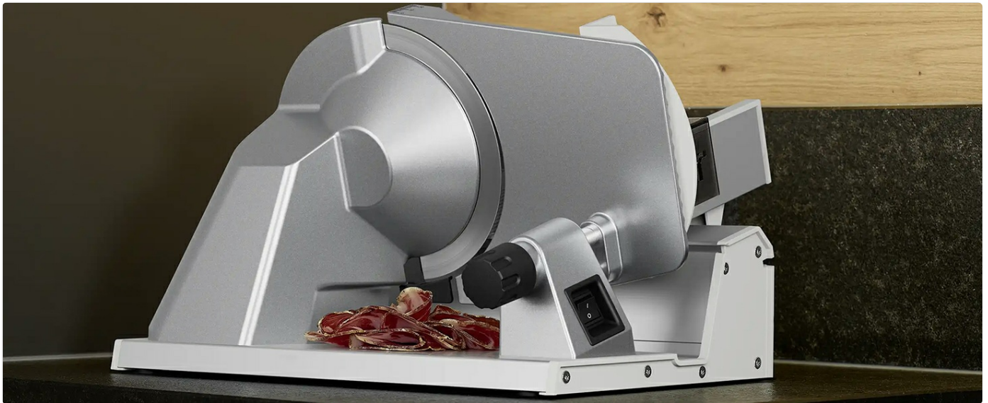
Image: The ritter compact 1 electric slicer actively slicing cured meat, demonstrating its functionality and precision.