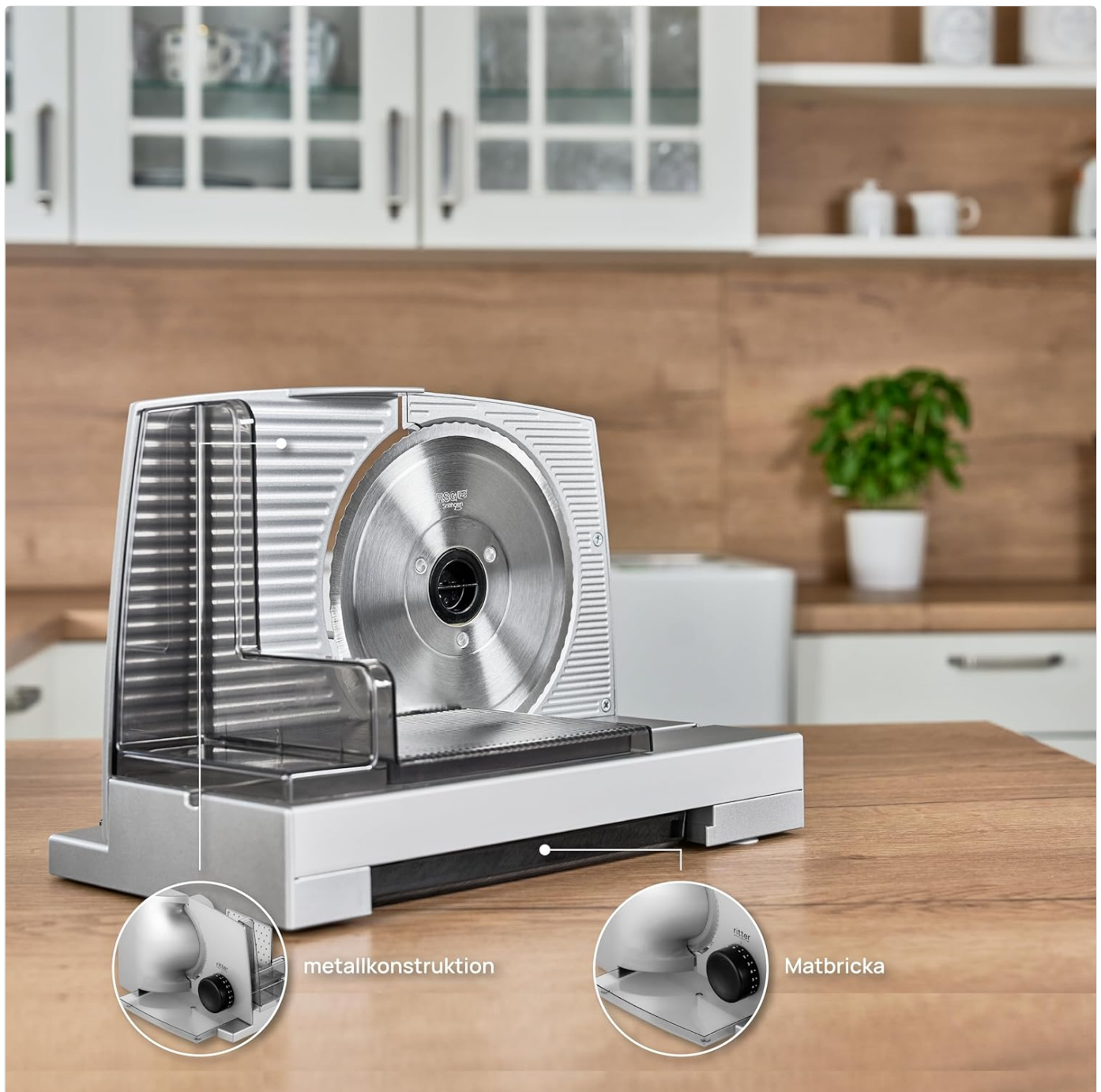
Image: The ritter compact 1 slicer highlighting its metal construction and the removable food tray for easy setup and cleaning.