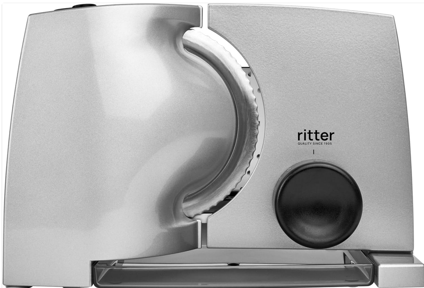
Image: Front view of the ritter compact 1 electric slicer, showcasing its sleek design and control knob.

The ritter compact 1 universal electric slicer is a high-quality kitchen appliance designed for precise and efficient slicing of various food items. Its robust metal construction and powerful ECO motor ensure reliable performance and durability. This manual provides essential information for the safe and effective operation, maintenance, and troubleshooting of your new slicer.